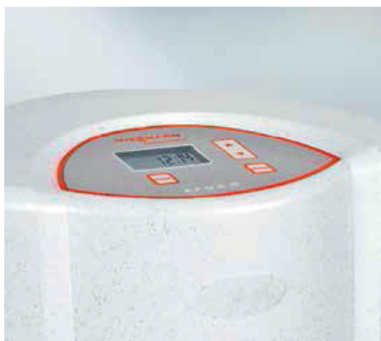
Электронная панель управления фильтра Aquacarbon обеспечивает простую и удобную эксплуатацию